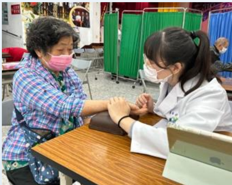
學生擔任初診醫師