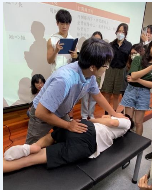
傷科疾患推拿手法實作