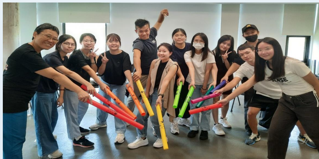
音樂治療理論與實作