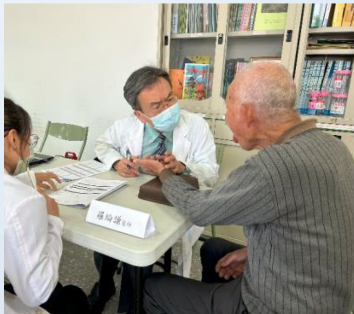
複診醫師診斷與處置