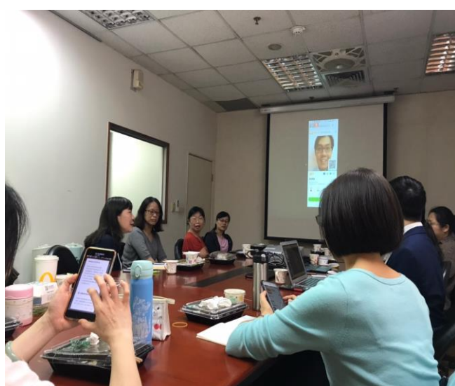
講者邀請大家實際體驗 app