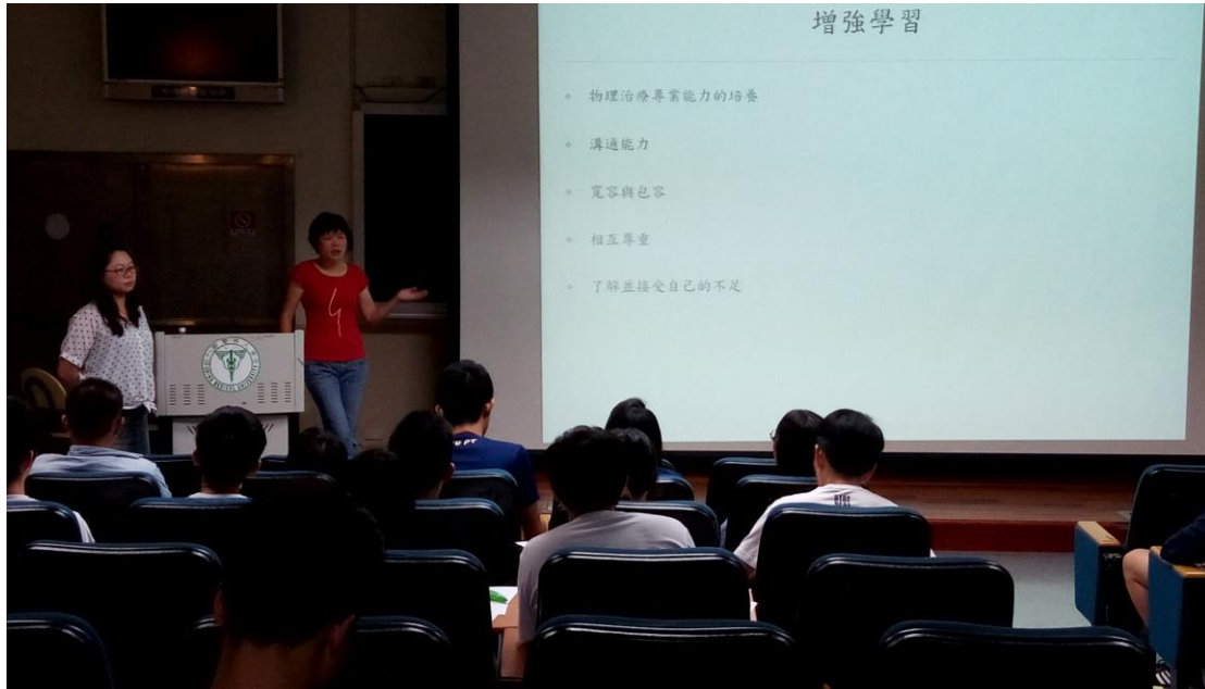
演講時同學們認真傾聽老師的演說