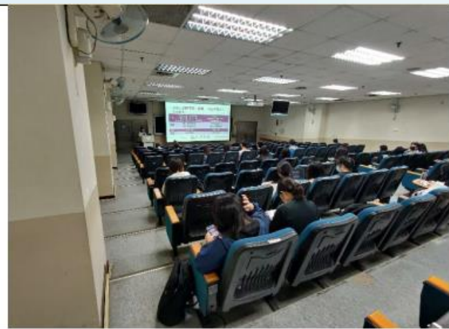
同學們均十分認真的聆聽講師的精彩演講