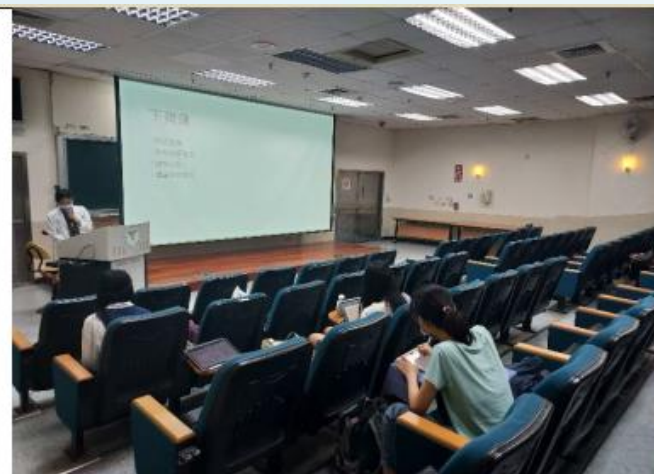
同學們均認真的聽講師講授關於下背痛的症狀鑑別、診斷、藥物針灸治療及衛教