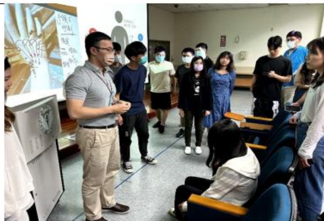
老師示範針灸-腰痛病例