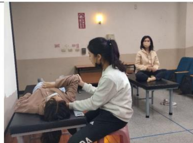
同學們均認真的實際當場操作，有問題時也可以馬上詢問講師