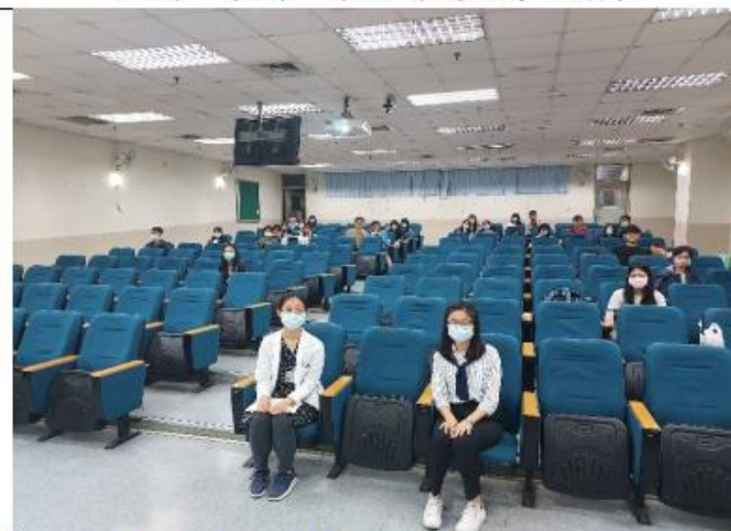
講師與聆聽講座之同學一同大合照