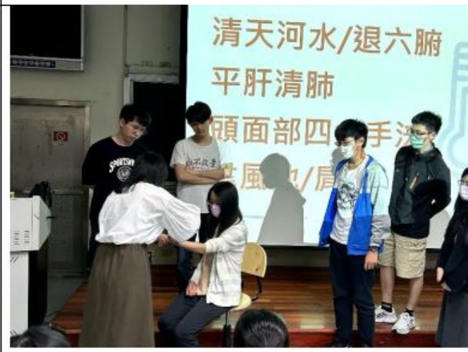
醫師示範清天河水方法