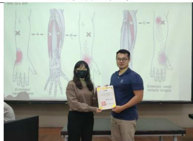
頒發感謝狀，感謝講師特地撥空，帶來如此精彩的演講