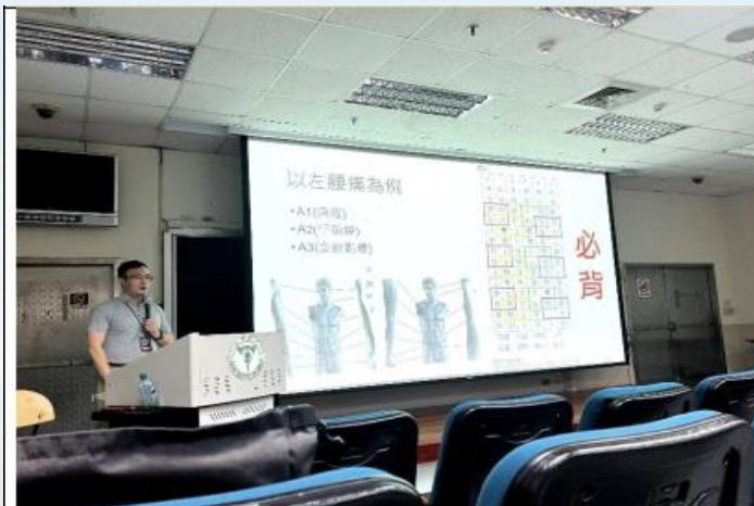
老師講解以左腰痛為例臨床如何思考配穴