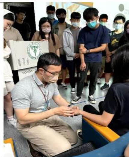
老師示範針灸-腰痛常用穴位