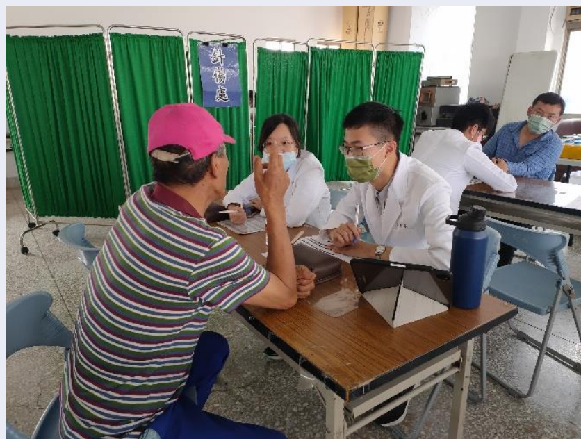
初診同學詳細地向病患問診以及把脈