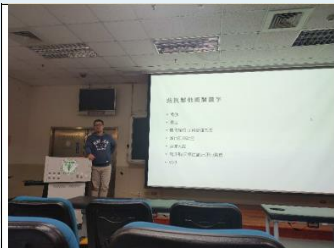
同學們均認真的聽講師講授關於拮抗鬆弛術的定義、原理與操作手法