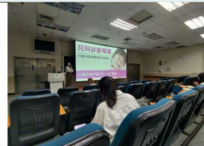
講師帶來精彩的中醫兒科演講，從常見的疾病、診斷項目與辨證都十分的詳細