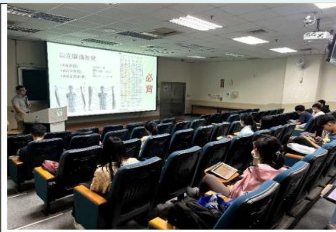
同學們均認真聆聽講師精彩的演講