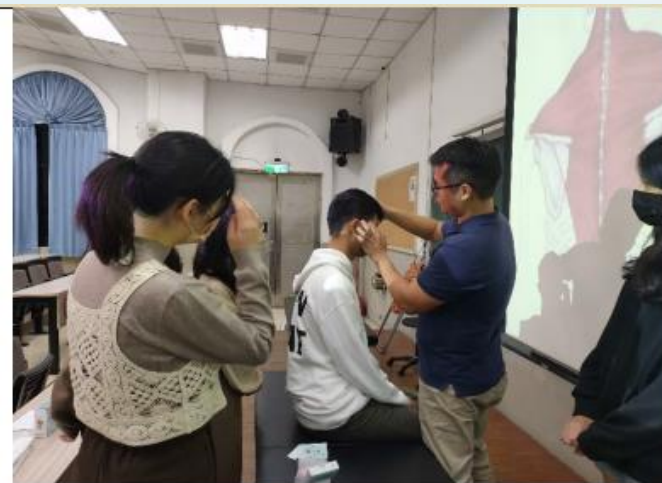
同學們均認真的聽講師講授如何找尋頭部的激痛點與如何治療