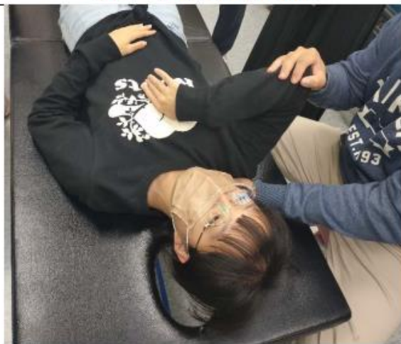
針對常見的前頸部痠痛，講師示範如何使用拮抗鬆弛術達到緩解效果