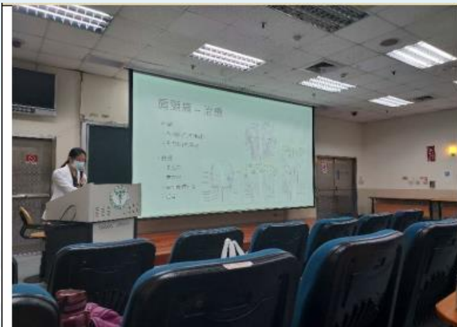
講師講授常見的肩頸痛，其症狀鑑別、診斷、藥物針灸治療及衛教，均是十分實用的知識