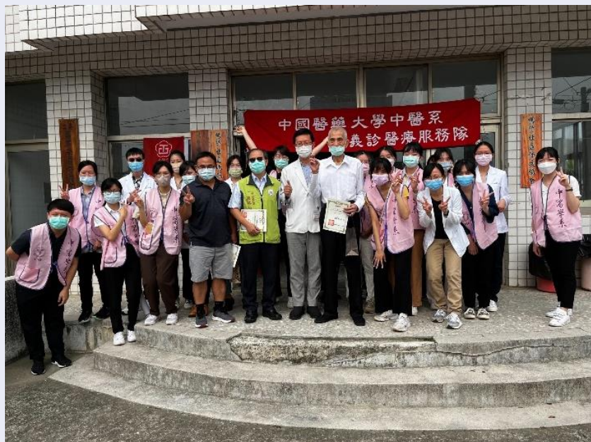
開幕式~與兩位醫師與雲林縣中醫師公會理事長的合照