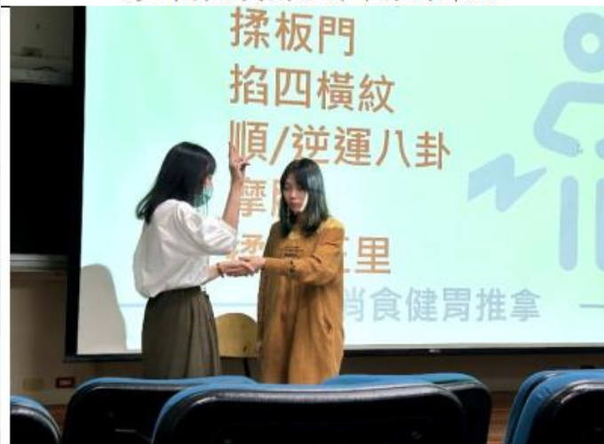
醫師示範揉板門手法（以消食健胃）