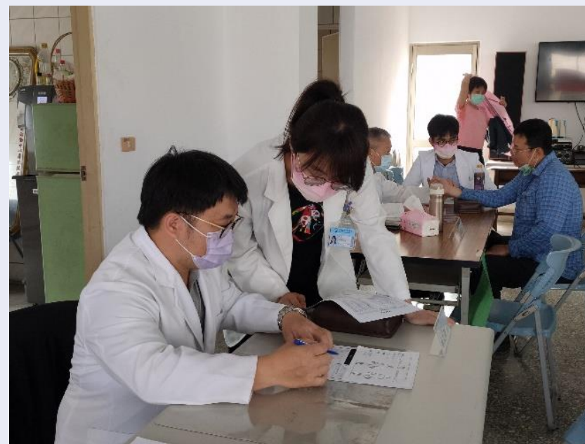
初診同學認真地向複診醫師請教