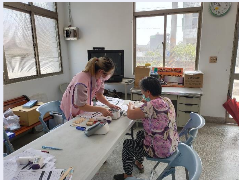
掛號組：幫病患量體溫、血壓以及體重