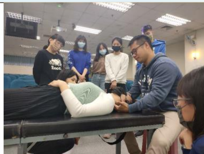
針對常見的後頸部痠痛，講師示範如何使用拮抗鬆弛術達到緩解效果