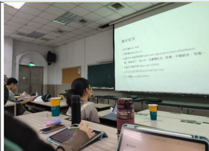
同學們均認真的聽講師講授關於激痛點的定義、鑑別診斷、臨床症狀與治療